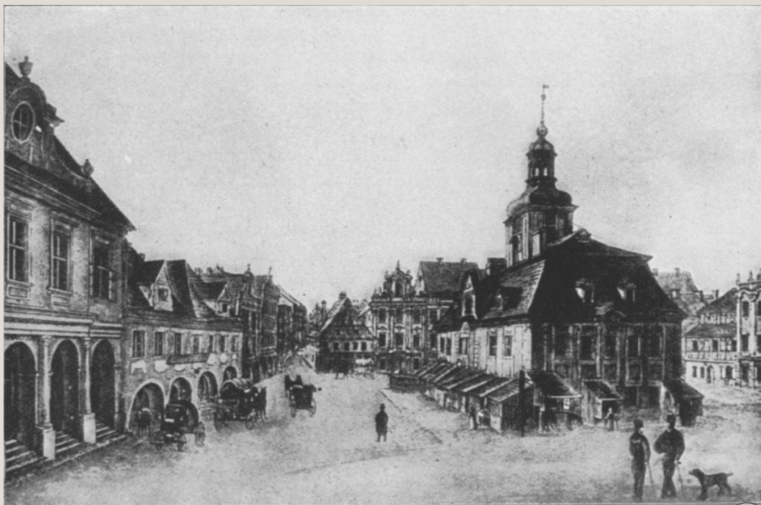
Alter Ring mit altem Rathaus

https://polska-org.pl/670487,foto.html?idEntity=524310